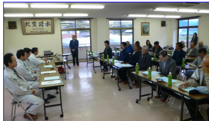
吉野川北岸土地改良区での研修

当土地改良区では、総代就任の翌年度に総代一日研修として吉野川北岸用水の水利状況を視察してまいります。平成十八年四月十四日に吉野川北岸土地改良区、池田ダム、早明浦ダムを視察研修いたしました。早明浦ダムを視察しながら、配水施設の管理状況・水利権など運営の参考となる研究ができました。